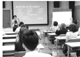
あいさつの手話指導