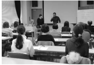
～ 講座の様子 ～

4月から平成31年度の手話奉仕員養成講座(基礎編)を開講します。修了された方々はぜひ下記の〈基礎編〉へステップアップし、知識と技術のレベルアップを目指しましょう。