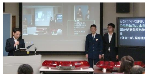
聴覚障がい者に配慮したパトカーの赤色灯