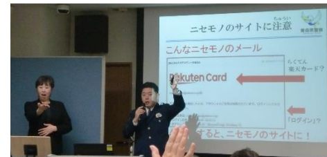
いま気を付けたいインターネット犯罪