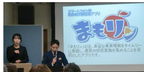
青森県警察防犯アプリ「まもリン」