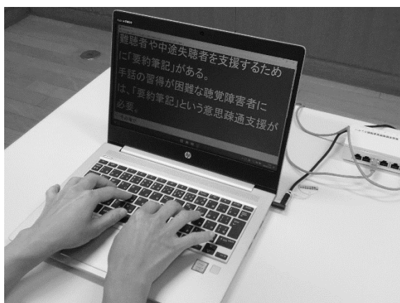
パソコン要約筆記